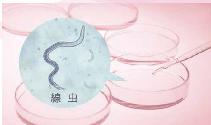
線虫（線形動物）ががんの匂いに引き寄せられます。

嗅覚に優れた線虫（線形動物）を用いて、尿中のがんの匂いからがんリスクを調べる最新の「生物診断」です。線虫がん検査は簡単に痛みがなく、安価で全身網羅的にがんリスクを調べることができる話題の検査です。（当院では行っておりません）線虫がん検査は、がん患者を「